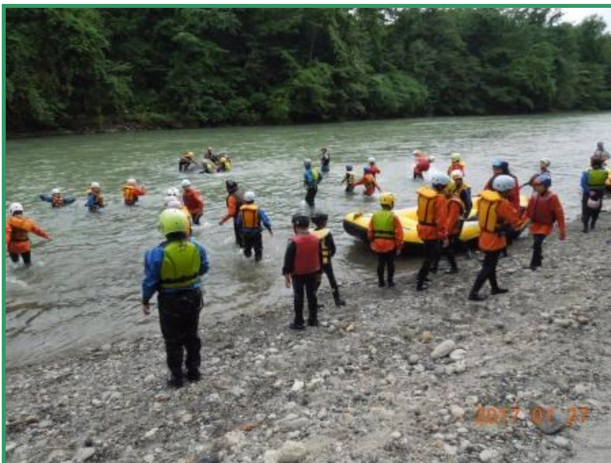
自然体験学習・川下りを行う十勝の子ども達

Email：ktm-wakamatsu-s2@Hokkaido.school.ed.jp