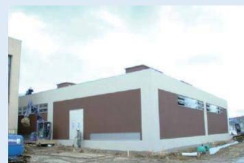
スポーツトレーニングセンター (i-WELL)