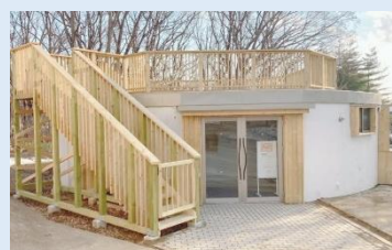
森の岩ギャラリー