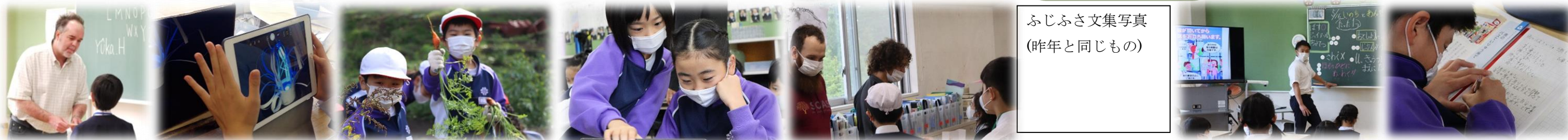
ふじふさ文集写真 (昨年と同じもの)