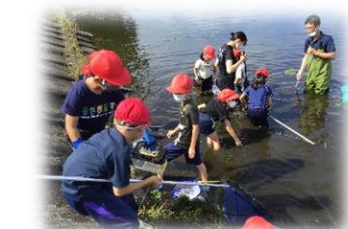
茨戸川 校地の裏にある茨戸川ではエビや魚がたくさん捕れます。生活科の学習では探検に出かけます。

本校児童は、札幌市全域から通学しています。そのためバスなどの公共交通機関を利用して通学している児童が、全校児童の90%(令和4年度)に及びます。地下鉄麻生駅・栄町駅、JRあいの里駅と本校の間には、本校児童用通学バスが運行(増便)されており、多くの児童が登下校に利用しています。