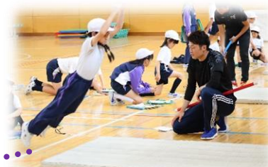
教育大学札幌校 大学が隣接しており、大学生や大学院生が訪れ、実習等を行います。