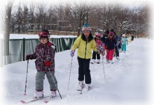
附属山 学校の裏にある附属山ではスキーやそり滑りを楽しむことができます。