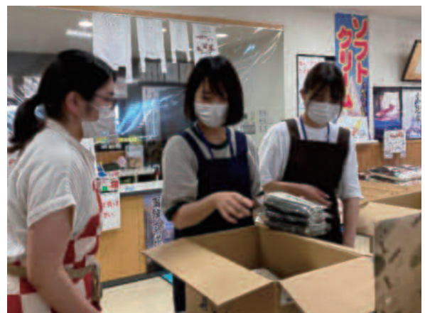
昆布の直販加工センターでの実習風景

実際に私たちが地域に与える影響は微々たるものかもしれませんが、地域の人が考える機会の少ない10年・20年後を、少しでも意識するきっかけになったとすれば、この実習の意義はあったのではないかと思います。