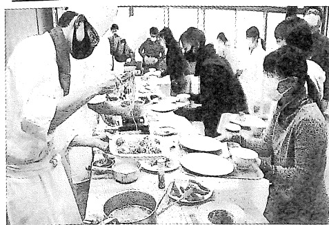
調理を取り分ける生徒

【釧路発】厚岸翔洋高校（三田村司校長）は12日、同校で海洋資源科調理師コースの成果発表会を行った。3年生10人が、これまでの調理実習の成果を保護者らに発表。それぞれ、自分が決めたメニューで3品以上の料理を振る舞い、感謝の気持ちを表現した。