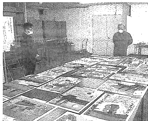
市役所で行われた審査会の様子(釧路)

審査会を開き、係書類を提出。同大の教員らで構成する選考委員会の2次にわたる審査で受賞が決まった。昨年12月4日の授賞式(東京)で表彰状が授与され、選考委員より「『問題解決の授業』が日常化されていることを裏付ける単元1時間ずつの学習状況が明確に分かる学習指導案』などの講評を受けたほか、授業映像も配信された。