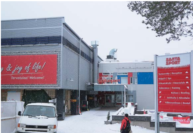
写真1 サンタスポーツ正面玄関

レジャースポーツのサービスとして、アルペンスキー、クロスカントリースキー、クライミング、あるいはボーリングなどがあり、各種球技の道具の貸出もある（写真2）。