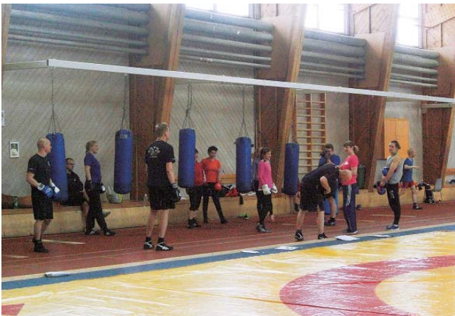
写真11 大人のボクシング教室

子どものレスリング教室の横では、大人のボクシング教室が開かれていた。男女合わせて20人弱くらいの規模であった。インストラクターが、サンドバックにパンチの打ち方を示範し、その後に参加者を順番に打たせ、その行い方についてアドバイスをしていた(写真11)。