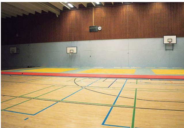
写真8 体育館内柔道練習場

運動・スポーツに関する職業教育とは、運動・スポーツやコーチングに関する職業資格教育や、障がい者スポーツにかかわる職業教育が行われる。それは指導スタッフのもとで実践を通して、実際のさまざまな業務を見習い体得していく、いわば徒弟教育として行われる。トレーニングセンターとしてナショナルスポーツチーム、10の競技スポーツ団体、地域のスポーツクラブ、アスリート個人を支援している。フィンランド、ならびに外国のトップアスリートやチームが大きな大会やトーナメント前の調整のためにパユラハティを利用している（写真8）。調査時には、フィンランド女子柔道代表選手が練習を終え、帰宅するところであった。館内にはナショナルチームの柔道着がハンガーに掛けられ並べられていた。