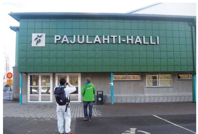
写真7 パユラハティ体育館

パユラハティ（Pajulahti）は、首都ヘルシンキ（Helsinki）から車で1時間ほどの距離に位置するラハティ（Lahti）市からなお車で15分ほどのナストラ（Nastola）にあるスポーツトレーニングセンターである（写真7）。