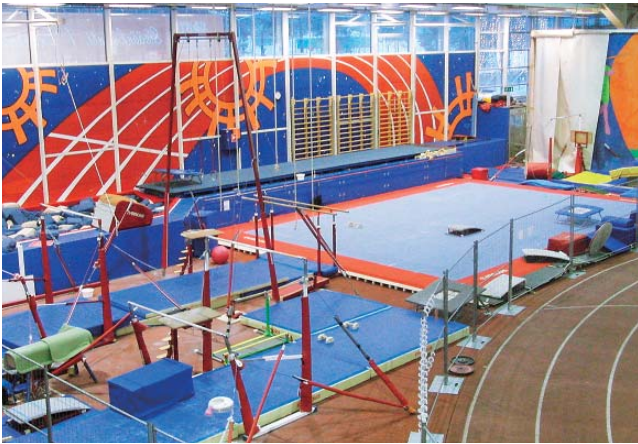
写真3 陸上競技トラック脇の体操競技練習場