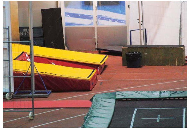
写真6 棒高跳びピット