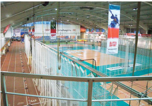
写真5 陸上競技場直走路部分と球技コート

北海道には、日本女子短距離の第一人者である福島千里選手が練習をしているハイテクACの室内陸上競技場（恵庭市）がある。その規模は、130mの直走路が5レーンあるという程度である。それに対してサントスポーツは300mの曲走路、走り幅跳び・三段跳びの砂場を有し、走り高跳び・棒高跳びのマットも常設されていた（写真5, 6）。また、投てき競技に関しては砲丸投げ、円盤投げやハンマー投げの練習もできる設備が整っていた。