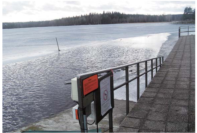
写真12 湖で泳ぐための出入口としてのスロープ

この施設の前にある湖では、いつでも入水できるように湖畔にはアプローチがあり、使用区域だけ氷が割ってある(写真12)。