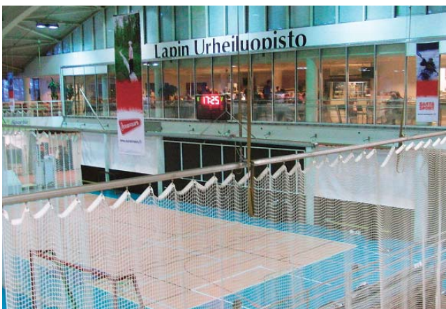
写真2 室内陸上競技トラック内の球技コート

レジャースポーツのサービスとして、アルペンスキー、クロスカントリースキー、クライミング、あるいはボーリングなどがあり、各種球技の道具の貸出もある（写真2）。