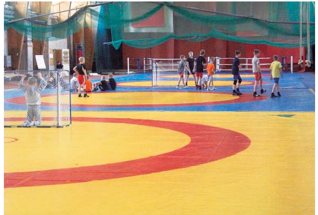
写真9 レスリング教室の子どもたち

んでいた。その子どもたちもインストラクターが来て、午後のプログラムが開始される頃には、指示されることなくフットサルをやめ、レスリングの準備をしていた（写真9）。