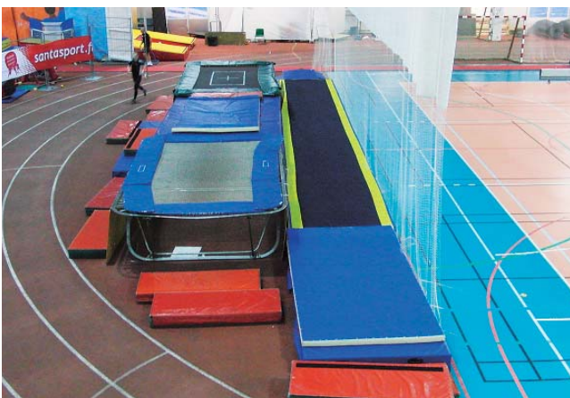
写真4 陸上競技トラック内のトランポリン練習場

北海道には、日本女子短距離の第一人者である福島千里選手が練習をしているハイテクACの室内陸上競技場（恵庭市）がある。その規模は、130mの直走路が5レーンあるという程度である。それに対してサントスポーツは300mの曲走路、走り幅跳び・三段跳びの砂場を有し、走り高跳び・棒高跳びのマットも常設されていた（写真5, 6）。また、投てき競技に関しては砲丸投げ、円盤投げやハンマー投げの練習もできる設備が整っていた。