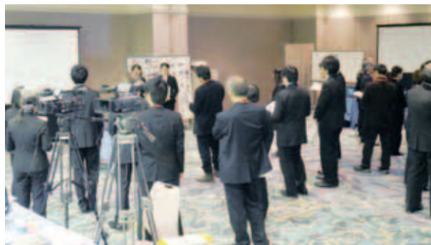
〔各ブースでのポスターセッション〕

本日は札幌、旭川、釧路の教員養成3キャンパスの学生11名からこの時間報告をして頂きます。