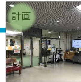
スペースが手狭であり、設備も老朽化が著しい