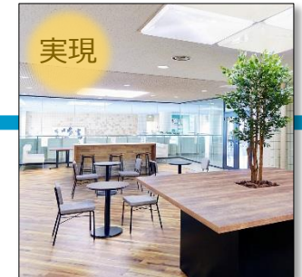
スペースを拡張し、飲食可能なラウンジエリアを整備