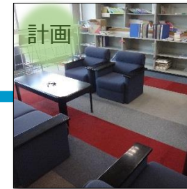
老朽化した共用スペース