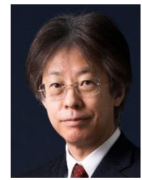
北海道教育大学長