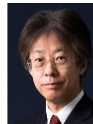
北海道教育大学長