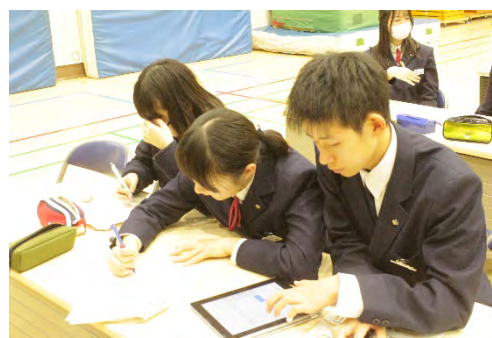
社会科における「財政プログラム」における ipad を活用した交流の場面