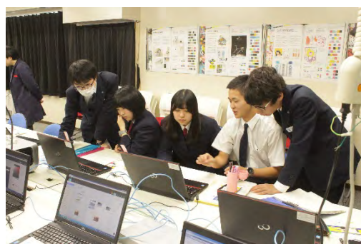
技術科美術科の合同における PC を活用した対話場面