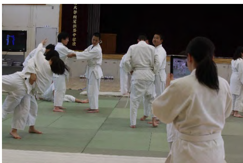
保健体育科における ipad を活用し、互いの動きについて記録する場面