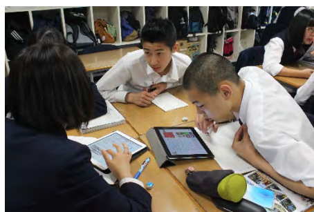
社会科における ipad での交流の場面