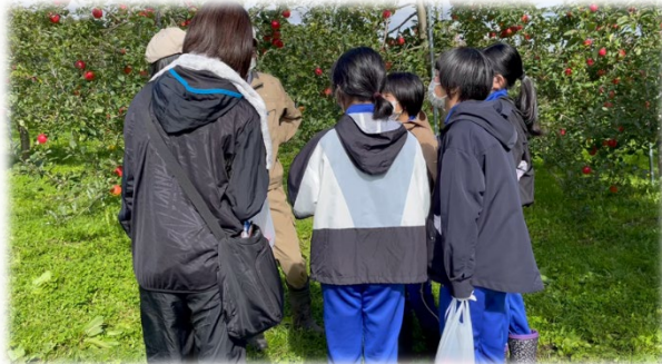
図3 りんご園での栽培に関する英語会話

A コロナ禍において、直接交流が難しい本年度前期に、zoom等やICT機器を活用した双方向の交流を持ち込み、遠隔双方向授業を対面授業とバランスよく組み合わせたブレンド型異校種交流授業の手法を用いた下記の様な取り組みの事例開発と検証を継続的に取り組んだ。