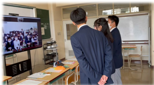
図2 双方向遠隔システムによる英語会話授業