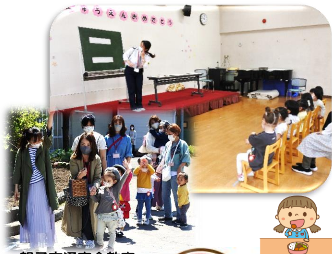
親子交通安全教室