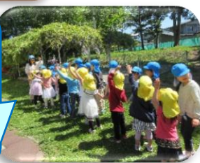
ゆき組さん と一緒に小学 校の応援に行 ったよ！