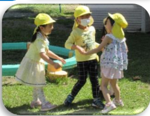
ちえ先生と音 遊びをしたよ♪ ピアノの音をよ 〜く聴こうね☆