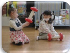
おしさんいっぱいみつ けたよ♪かわいいね☆