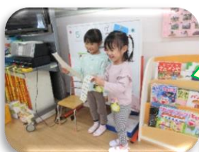
まいにちのおとうぼん がんばるよ！