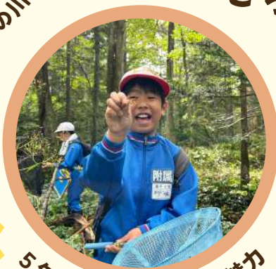
5年 「しろの産業・魅力」