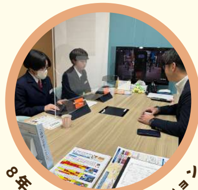
8年 「しろパワーアクション」