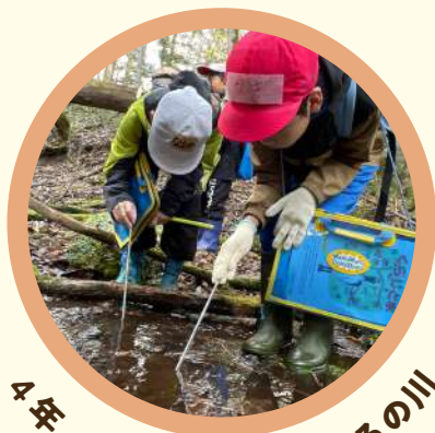
4年 ぼくらの川、くしろの川