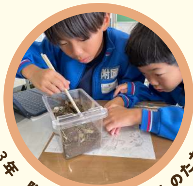
3年 附小のまわりのいきものたち