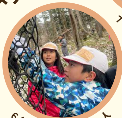
6年 「しろの歴史・人」