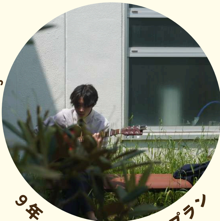
9年 「しろマスタープラン」