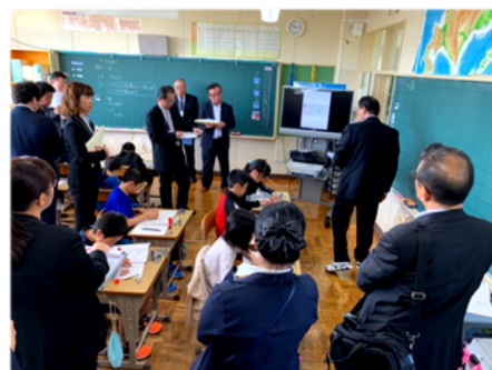
へき地校の公開授業研究会

へき研センターでは、学校や教育委員会と連携した公開研究会や実践研究を進めております。これまでも、全国へき地教育研究大会、北海道へき地複式教育研究大会、各管内へき地教育研究大会、市町村へき地教育研究大会、学校主催へき地教育研究公開研究会など、様々な学校現場の研究大会へも多くの大学教員が参加し、学校と連携しながら、実践的な研究活動を進めてきました。