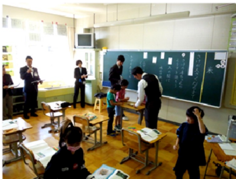
全道へき地教育研究大会公開授業研究会

いますので、今後も多くの大学教員に参加して頂ければ幸いです。その中で、学校現場と連携した実践研究・実証研究も進めることができます。できるだけ多くの教員の皆様に、公開研究会等のご案内をさせていただきますので、引き続きどうぞよろしくお願いいたします。