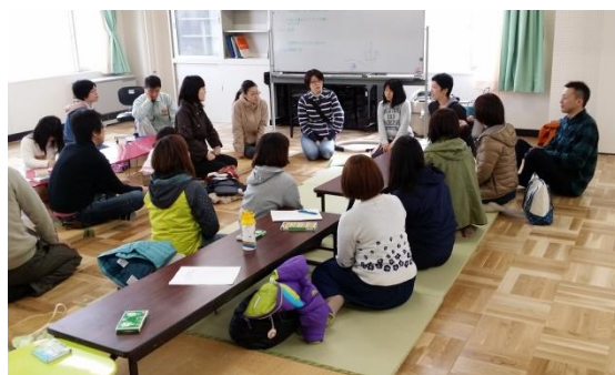
保護者意見交換会の様子

食農体験活動ごとに子供の成長が感じられ、毎回元気をもらっています。子供から大人まで、それぞれの悩みを共有したり、のびのびと活動できるよう、今後も多くの意見交換をしながら、活動に取り組んでいきたいと思えます。