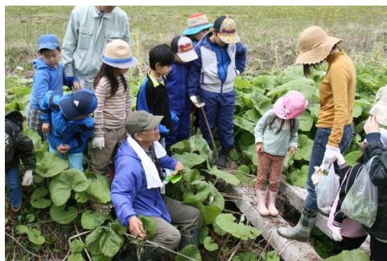
野外教育研究会連携の様子

大学と学生と親との三者によって実行委員会を設置し、食農体験の他に、野外教育研究会との野外散策、食物アレルギーや発達障害、アンガーマネジメント等に関する学習会を実施しています。