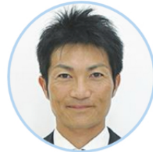
梅澤秋久 横浜国立大学 教授